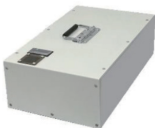
内蔵のポータブル蓄電池